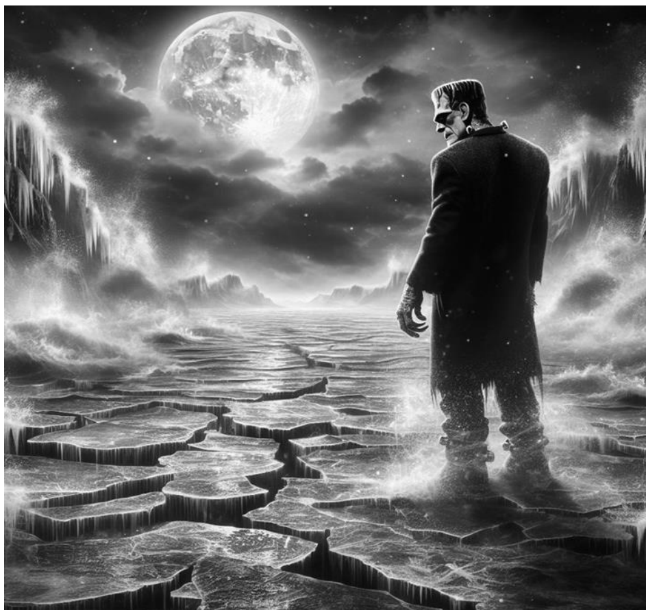
Illustration générée avec l'aide de l'I.A.

Ou l'étonnante histoire de la création du roman « Frankenstein ou le Prométhée moderne », premier roman de science-fiction né du mauvais temps et d'une randonnée sur la Mer de Glace, et celle de son auteure Mary Shelley dans le contexte historique de leur époque, et leurs rôles dans le développement du voyage en haute montagne et à Chamonix Mont-Blanc – parmi un corpus littéraire paru entre la dernière moitié du 18 ème siècle et de la fin du 19 ème .